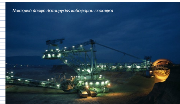
Νυκτερινή άποψη λειτουργίας καδοφόρου εκσκαφέα